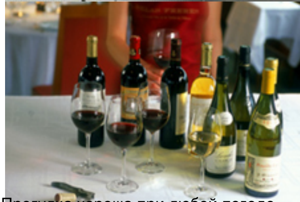
Прогулка хороша при любой погоде.

Домашнее задание: подготовить презентацию о круизе по Сене